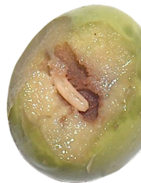
Larva de Bactrocera oleae

O nível máximo de intensidade de voo observa-se em julho e outubro, sendo mais elevado o segundo que o primeiro.