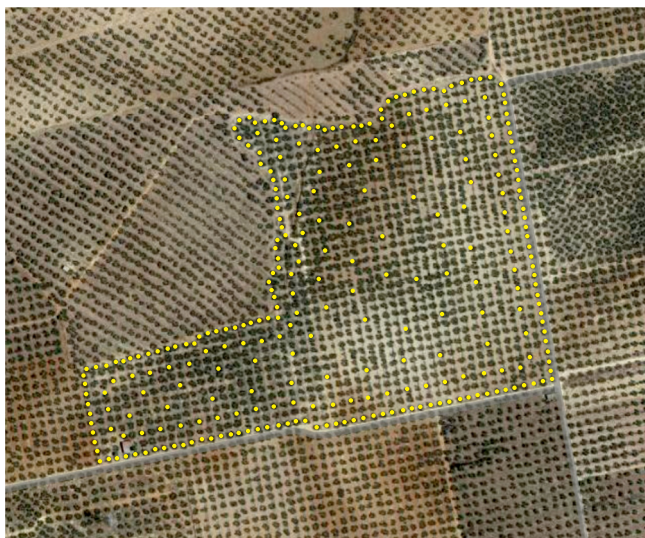
● = Armadilha ECONEX FOSFATO DIAMÓNICO BO KIT

No caso de parcelas contíguas com outras que tenham um alto nível de estragos, recomenda-se reforçar os limites das mesmas colocando uma barreira de armadilhas separadas entre si de 5 a 10 metros, como se observa na imagem: