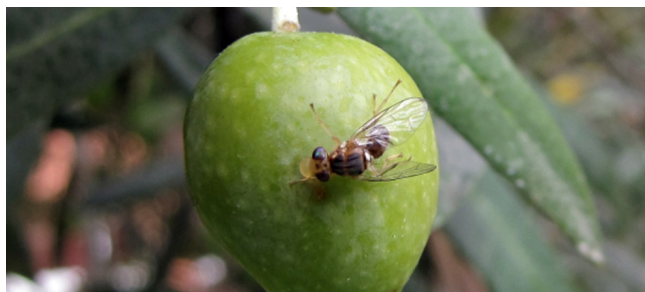
Bactrocera oleae sobre uma azeitona

Reabastecer se se evapora mais do que 1/3 da água. Utilizar luvas de protecção.